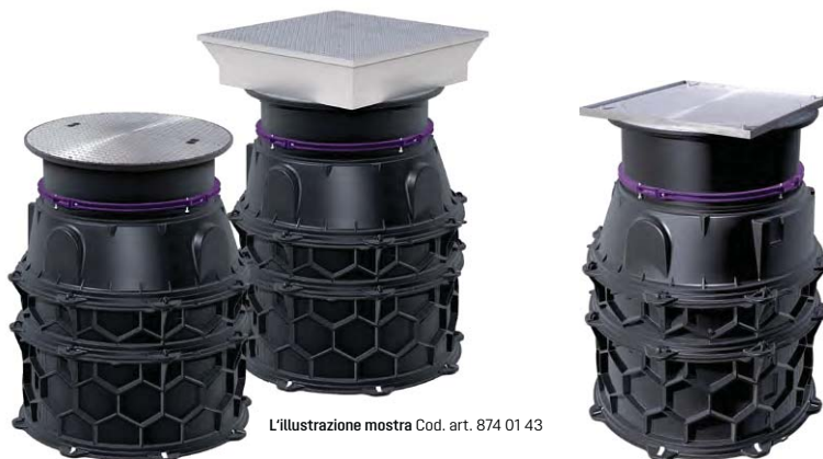
L'illustrazione mostra Cod. art. 874 01 43

Nota: Altre profondità di posa, sezioni superiori e coperture classe B/D a richiesta