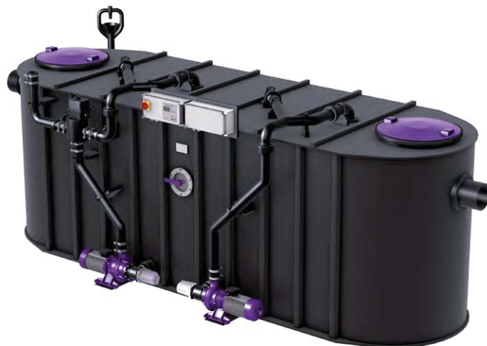
Illustrazione mostra dimensioni nominali NS 20 - 30 (NS 15 con pompa singola)